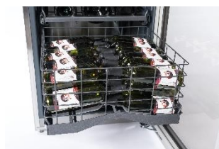
Massenlagerung am Boden