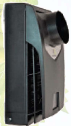
Ansicht der Rückseite mit optionalem Kanaladapter