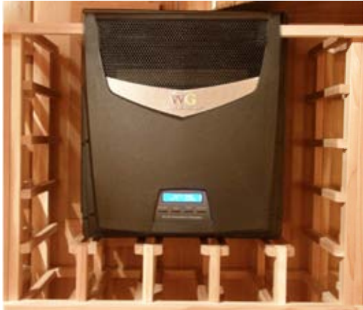
Frontansicht im Gestell