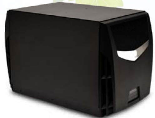
Wanddurchgängige Einheit außerhalb des Gestells